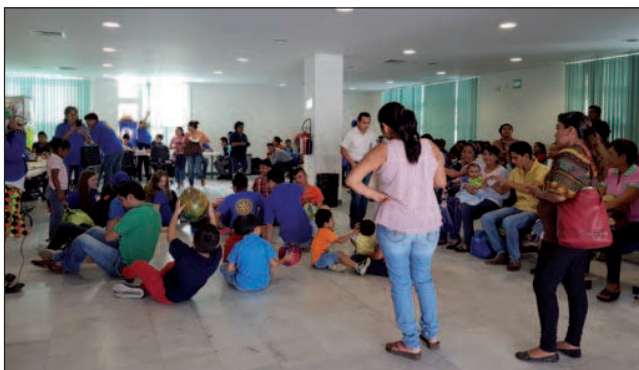
Fig. 1. Pacientes en espera de ser atendidos cada primer lunes de mes en la Clínica de Labio y Paladar Hendido del Hospital General “Dr. Agustín O’Horan”, Mérida, Yucatán, México.