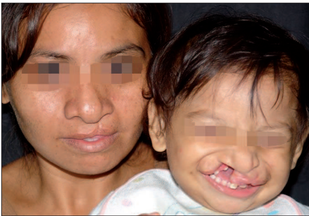
Fig. 12. Mujer de 21 años de edad con labio y paladar hendido izquierdo con su hija de 9 meses con labio hendido bilateral, ya reparado en otro centro el lado izquierdo.

pacientes entre 2005 y 2010 en el Hospital General de Salubridad.