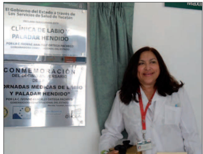
Fig. 2. El 6 de junio de 2011, el Gobierno y la Secretaria de Salud del estado inauguraron la Clínica de Labio y Paladar Hendido del Hospital General “Dr. Agustín O’Horan”. A partir de ese momento tuvimos un espacio físico permanente para trabajar.

A lo largo de sus 17 años de actividad se han realizado en esta clínica del Hospital “Dr. Agustín O’Horan” 18 jornadas quirúrgicas con un promedio de 50 a 60 pacientes operados de labio y paladar hendido y/o sus secuelas en cada jornada (Fig. 3). Además, con el apoyo de Sharing Smile y Smile Train hemos llevado a cabo otras 22 jornadas quirúrgicas en otros estados del sureste de la