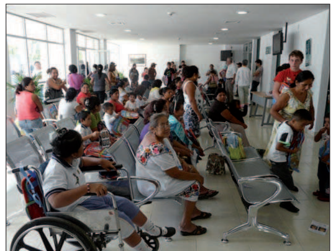
Fig. 3. Pacientes en un domingo de la jornada quirúrgica, durante la valoración preoperatoria.